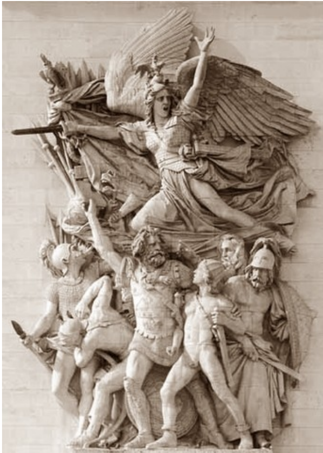
Le Départ des Volontaires de 1792 de François Rude

« Faire reconnaître la participation du Régiment aux durs combats de 1940, tel est notre engagement ! »